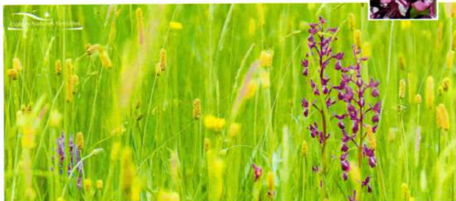
ORCHIS A FLEURS LÂCHES

C'est dans les prairies humides à tourbeuses où elle fleurie au printemps que l'on peut observer cette belle orchidée à fleurs rose violacé groupées en épi lâche. Cette espèce est très sensible aux perturbations apportées à son milieu et disparaît rapidement après drainage ou amendement des prairies. En Auvergne, cette plante est très rare et en régression. Elle n'est présente dans le département de l'Allier que dans quelques stations de plaine.