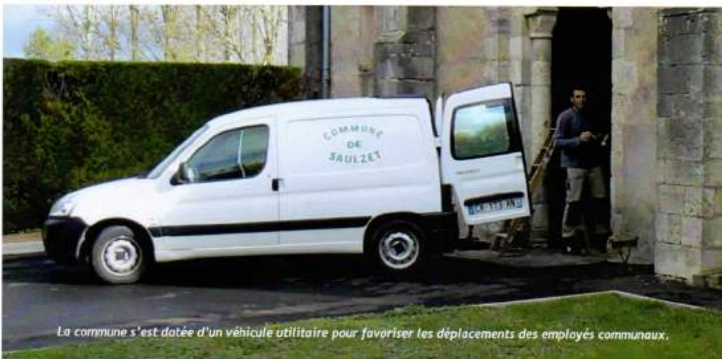
La commune s'est dotée d'un véhicule utilitaire pour favoriser les déplacements des employés communaux.